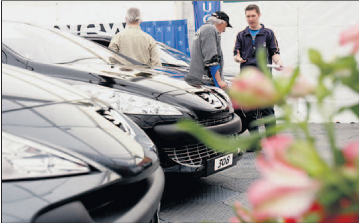
Beratungs- und Verkaufsgespräche in ruhiger Atmosphäre wie in Bülach werden von Kunden und Händlern geschätzt.